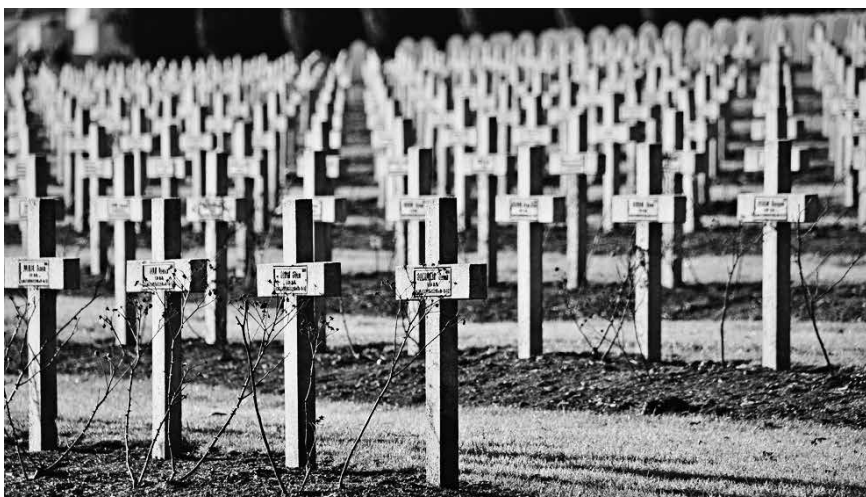
Der Wahnsinn des 1. Weltkrieges – abgebildet mit diesem Soldatenfriedhof.

Der 1. Weltkrieg ist ein mahndes Beispiel dafür, dass Gott nie wieder für die Rechtfertigung des Krieges oder der Gewalt missbraucht werden darf. Die Kirche muss sich gegen jede Verherrlichung des Krieges wehren und sich für einen bedingungslosen Frieden auf der Welt einsetzen.