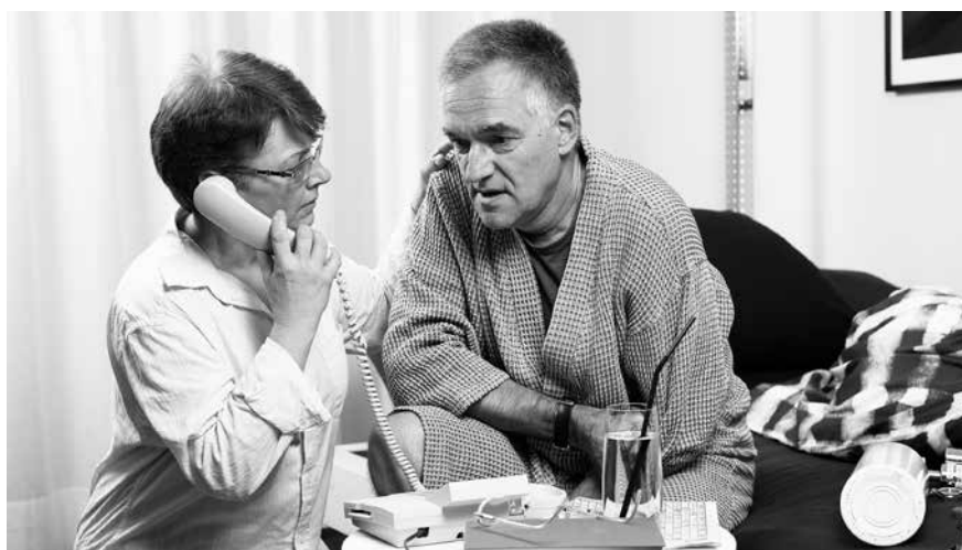
Das Pallifon hilft Palliativpatienten in Notfällen.